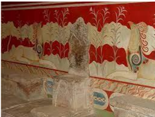
Αίθουσα του θρόνου.