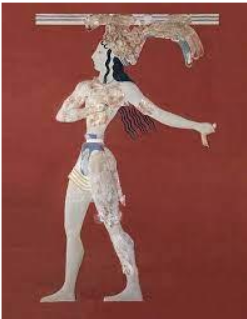
Ο Πρίγκιπας με τα κρίνα

Τα σύμβολα του Μινωικού πολιτισμού ήταν: τα κέρατα ταύρου και ο διπλός πέλεκυς.