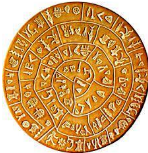
Ο δίσκος της Φαιστού Γραμμική Α`