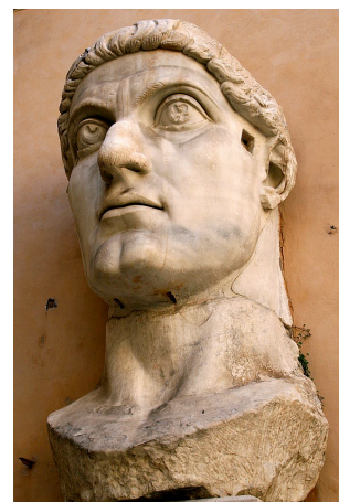
προτομή του Κωνσταντίνου Ρώμη, 313-324 μ.Χ.

Ο Κωνσταντίνος έκανε το χριστιανισμό νόμιμη θρησκεία το 313 μ.Χ. με το διάταγμα του Μεδιολάνου. Πίστευε επίσης ότι η χριστιανική Εκκλησία θα βοηθούσε την αυτοκρατορία να μείνει ενωμένη. Ο Μέγας Κωνσταντίνος βαφτίστηκε τελικά χριστιανός λίγο πριν πεθάνει (337 μ.Χ.).