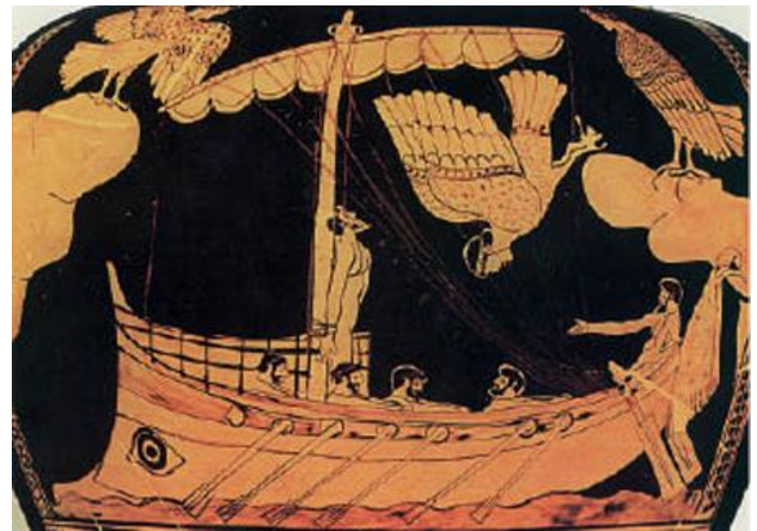
Ο Οδυσσέας, οι σύντροφοί του και οι σειρήνες