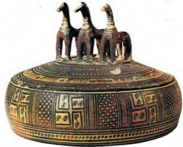
Γήλινο κουτί για κοσμήματα (πυξίδα)