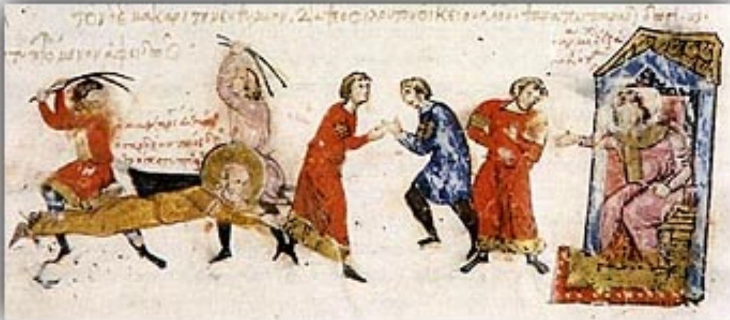
Στην εικόνα διωγμοί μοναχών. Λεπτομέρεια από το Χρονικό του Ιωάννη Σκυλίτση, τέλη 12ου-αρχές 13ου αιώνα. Madrid, Biblioteca Nacional, fol. 28vb.