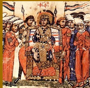
Αυτοκράτορας Θεόφιλος Χρονικό Ιω. Σκυλίτζη