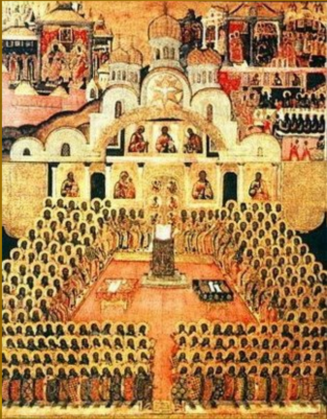
Ζ' Οικουμενική σύνοδος 17ος αι. Μοναστήρι Novodevichn, Μόσχα

«Όπως είδαν οι Προφήτες, όπως δίδαξαν οι Απόστολοι, όπως παρέλαβε η Εκκλησία, όπως δογμάτισαν οι διδάσκαλοι, όπως έλαμψε η αλήθεια... έτσι φρονούμε, έτσι λαλούμε, έτσι κηρύσσουμε ότι ο Χριστός είναι ο αληθινός Θεός μας.