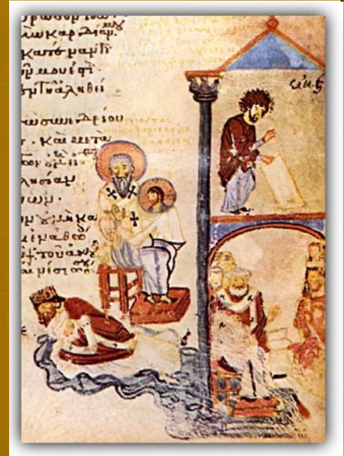
Στην εικόνα η Σύνοδος του 815. Μικρογραφία Ψαλτηρίου, 9ος αιώνας. Άγιον Όρος, Μονή Παντοκράτορος, κωδ. 61, φ. 16α.