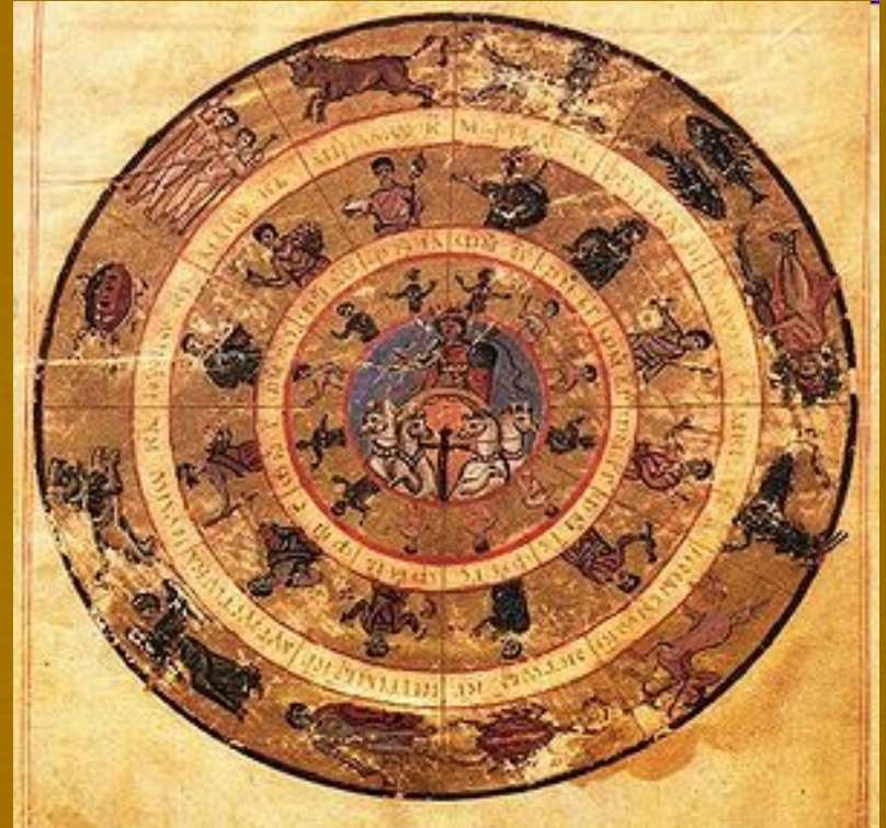
Ο Ήλιος πάνω στο άρμα του. Γύρω του οι μήνες και τα στοιχεία του ζωδιακού κύκλου. Βατικανό . Gr. 1291, Εποχή της βασιλείας του Κωνσταντίνου Ε΄