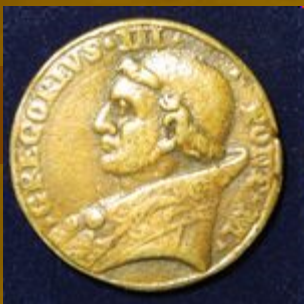
Ο Γρηγόριος Γ' σε παπικό μετάλλιο (8ος αι.)