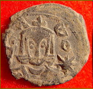
Κέρμα με τη μορφή του Λέοντα Ε΄