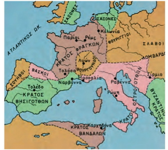
Τα γερμανικά ή βαρβαρικά βασίλεια ή κράτη και η εξέλιξή τους

Μετά τη διαίρεση της Ρωμαϊκής Αυτοκρατορίας σε Ανατολικό και Δυτικό τμήμα (395) το δυτικό αποδιοργανώνεται κάτω από την πίεση των γερμανικών φύλων. Τελικά καταρρέει το 476 και στη θέση του δημιουργούνται τα γερμανικά βασίλεια, τα οποία ανταγωνίζονται μεταξύ τους. Ανάμεσά τους ξεχώρησε το Φραγκικό βασίλειο που στους επόμενους αιώνες κατάφερε να επεκταθεί και να ισχυροποιηθεί. Έγινε χριστιανικό τον 4 ο αι. Στη Δύση, η Βυζαντινή Αυτοκρατορία έχασε τα περισσότερα εδάφη της στην Ιταλική χερσόνησο. Το 751 οι Λογγοβάρδοι κατέλυσαν το βυζαντινό εξαρχάτο της Ραβέννας. Λίγο αργότερα, το 754 ιδρύθηκε στην Ιταλική χερσόνησο το Παπικό Κράτος.