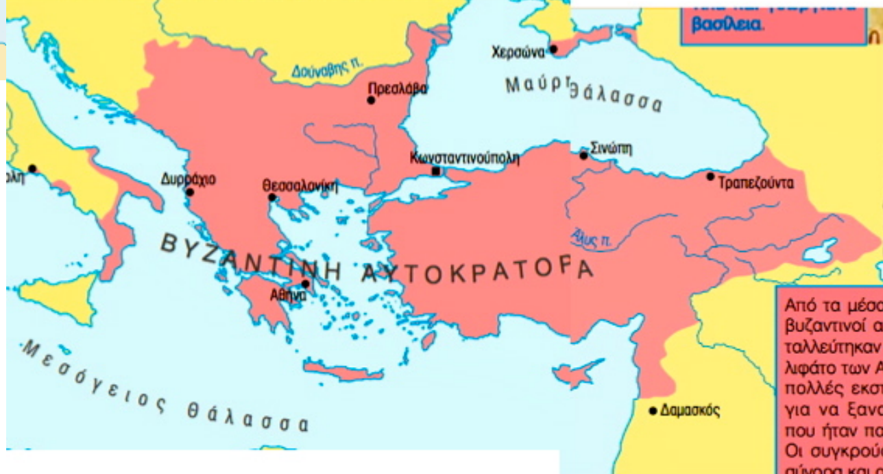
Η Βυζαντινή Αυτοκρατορία στα μέσα του 11ου αιώνα