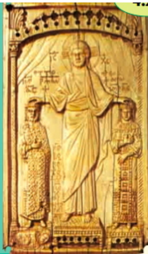
Πλακίδιο από ελεφαντόδοντο. Ο Χριστός στέφει τον Όθωνα Β' (973-983) και τη σύζυγό του Θεοφανώ. Το 972 ο Όθωνας Β', γιος και διάδοχος του Όθωνα Α', παντρεύτηκε τη Θεοφανώ, ανιψιά του βυζαντινού αυτοκράτορα Ιωάννη Ταμισκή (969-976). 10ος αιώνας, Παρίσι (Γαλλία), Μουσείο Κλινί.

Το 962 ο πάπας της Ρώμης έστεψε τον Όθωνα Α' (936-973) Αυτοκράτορα των Ρωμαίων. Έτσι ιδρύθηκε η Αγία Ρωμαϊκή Αυτοκρατορία . Ο Όθωνας Α' προσπάθησε να καταλάβει βυζαντινές περιοχές στη νότια Ιταλική χερσόνησο. Οι βυζαντινοί αυτοκράτορες, όπως και πιο παλιά με τον Καρλομάγνο (800), θεώρησαν τον Όθωνα Α' παράνομο και δεν τον αναγνώρισαν ως αυτοκράτορα. Ανάμεσα στα δύο κράτη δημιουργήθηκαν προβλήματα. Στη συνέχεια όμως αντάλαξαν διπλωματικές αποστολές . Ύστερα από συνθήκες και συμμαχίες οι σχέσεις τους έγιναν καλύτερες.