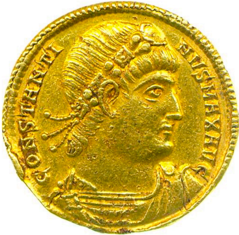
Χρυσό νόμισμα του Κωνσταντίνου, αρχ. 4 ου αι.