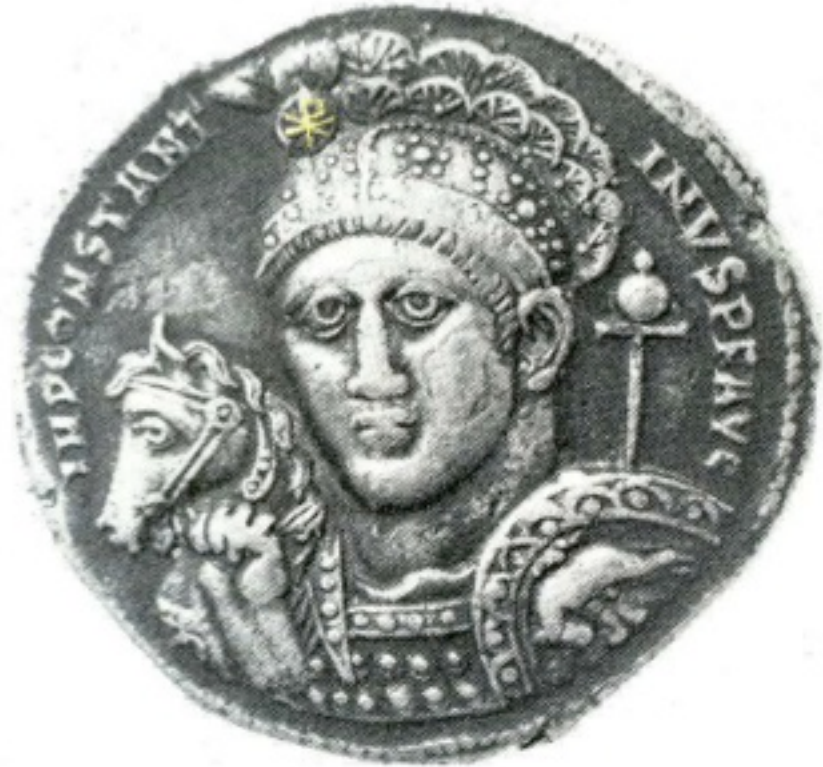
Αργυρό νόμισμα του Κωνσταντίνου, αρχ. 4 ου αι.