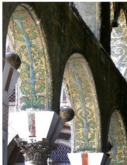
Το Μεγάλο Τζαμί της Δαμασκού (Συρία), αρχές 8ου αι. Στην εικόνα, η αυλή που οδηγεί στην αίθουσα προσευχής. Διακόσμηση με ψηφιδωτά. Δίπλα δεξιά, λεπτομέρεια ψηφιδωτών.