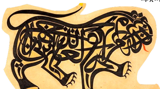
Λιοντάρι σχεδιασμένο με αραβικά γράμματα, από τον οθωμανό καλλιγράφο Ahmad Hilmi (1913)

Η καλλιγραφία είναι μια μορφή τέχνης που στον ισλαμικό κόσμο θεωρείται ιερή. Κι αυτό γιατί συνδέεται με το Κοράνι, το ιερό βιβλίο του Ισλάμ: σύμφωνα με την ισλαμική θρησκεία, το κείμενο του Κορανίου είναι κατά λέξη ο λόγος του Θεού, όπως τον αποκάλυψε, στην αραβική γλώσσα , ο αρχάγγελος Γαβριήλ στον προφήτη Μωάμεθ. Η καλλιγραφία