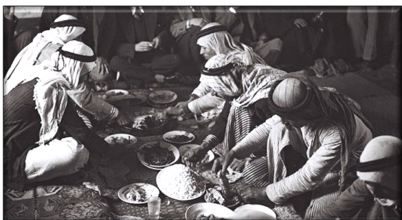
Γεύμα στο αραβικό χωριό Subrin (1940)