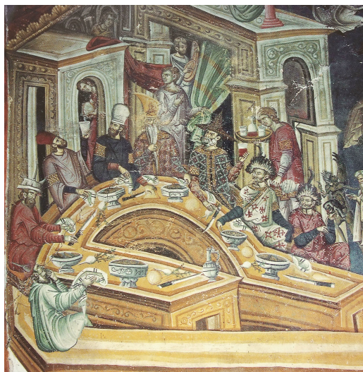
Τοιχογραφία στον εξωνάρθηκα, Ιερά Μεγίστη Μονή Βατοπεδίου, Άγιο Όρος, 14ος αι.