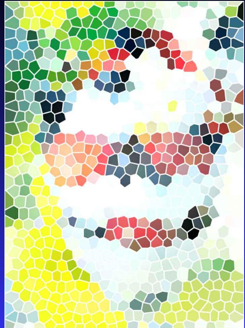
Εικόνα 1.1: Η δεύτερη εικόνα έχει σχηματιστεί με χρωματιστές ψηφίδες και προσπαθεί να αποτυπώσει την πρώτη φωτογραφία.